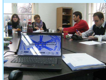
Fotografija sa radnog sastanka

PRONI Brčko je započeo sa promocijom Volonterskog dnevnika™ i do sada su aktivni volonteri u PRONI-u su dobili besplatne primjerke dnevnika.