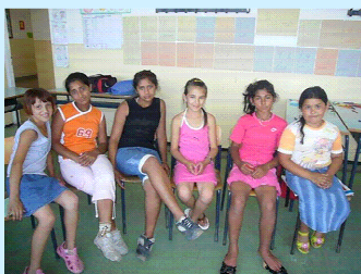
Grupa sa radionice u Prutačama