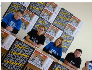
Fotografija sa konferencije za medije