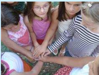
Radionice na temu dječijih prava u Bijeloj