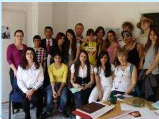
Obilježavanje Međunarodnog dana Roma u Bijeljini