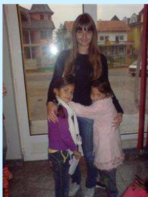
"Zabavom do znanja"

Grupa mladih aktivista koja se bori za otvaranje „Info centra“ u Bijeljini, aktivno je radila na pripremama kampanje za anketiranje građana i potpisivanje peticije. Dva puta sedmično su imali sastanke i radili na pripremama za istraživanje o zainteresovanosti mladih u Bijeljini za otvaranje Info centra, koju su iskoristiti za podnošenje projekta Načelniku opštine Bijeljina, odnosno, ideje za koju im treba podrška Opštine Bijeljina da bi ideja bila realizovana do kraja.