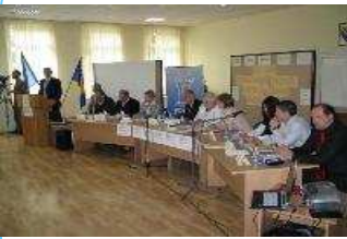
Francuska Ambasadorica u Brčko distriktu