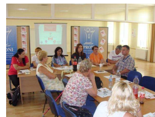
"Pozicija udruženja žena u Brčko distriktu!"

4. Ili podstaknuti inicijativu za osnivanje Vijeća udruženja žena (mrežu) koja bi se dalje brinula za interese udruženja i žena u Brčko distriktu, pa čak osnivanje fondacije za udruženja.