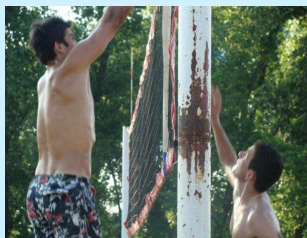
Odbojka na pijesku na igralištu na Ficibajeru

"Sasvski cvijet 2009" je tradicionalna manifestacija turizma, sporta i kulture, koja se u Brčkom održava već osam godina. Ove godine manifestacija je trajala od 25. jula do 15. avgusta.