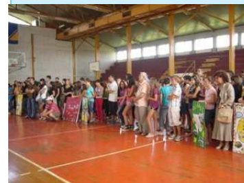
Početno postrojanje učesnika CIVITAS kampa.

svog učešća, kao i samog toka radionica. Realizaciju CIVITAS kampa su svojim prisustvom podržali Ambasador SAD-a u BiH, supervizor Brčko distrikta, Predsjednik i Dopredsjednik Skupštine Brčko distrikta, Gradonačelnik Brčko distrikta, kao i mnogi drugi dužnosnici Vlade Brčko distrikta BiH.