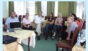
PRONI zaposleni na lldži 2009. godine

Mnogo je poslova odrađeno u ovoj godini, a što ćete imati priliku da vidite u narednim člancima. Međutim, zbog brojnih problema PRONI je ipak pretrpio gubitke i to u radnicima. U PRONI-u sada radi 8 zaposlenih u navedenim timovima.