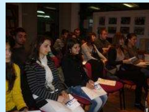
Okrugli sto : "Volonterizam u Bijeljini"!!!

Na ovoj svečanosti su dodijeljeni certifikati volonterima i aktivistima za ljudska prava, te zahvalnica onima koji su pomogli rad PRONI-a u sklopu ovog projekta.