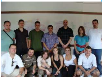
Trening u Križevićima

PRONI Centar za omladinski razvoj pruža i trenerske usluge. Na PRONI web stranici moguće se naći baza trenera u koju su uključeni zaposleni i dosta studenata koji su završili Trening za trenere u saradnji sa švedskim Univerzitetom u Jingčopingu.