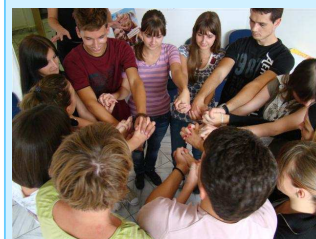
Prvi trening i upoznavanje učesnika u okviru projekta u Bijeljini

Rad na projektu se završio obilježavanjem dana dječijih prava 20. novembra i organizovanjem festivala dječijih prava pod nazivom "Danas je moj dan", na kome su učesnici imali priliku da građanima Bijeljine, pokažu rezultate rada svojih radionica, a tom prilikom je održana i kampanja o otvaranju Info centra u Bijeljini.