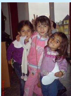
Fotografija sa volonterske radionice