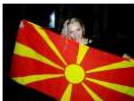
Trening u Makedoniji