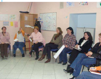
Fotografija sa treninga

Rad na ovom projektu završen je krajem školske 2008/2009. godine